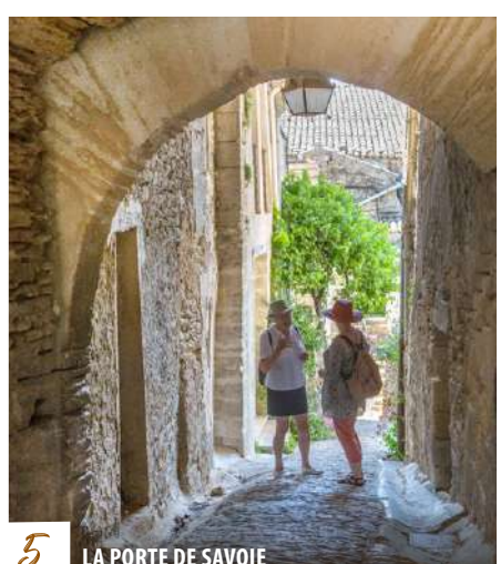
5 LA PORTE DE SAVOIE