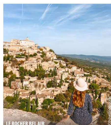
LE ROCHER BEL AIR