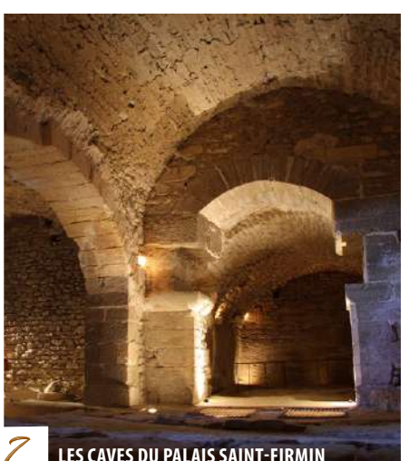
7 LES CAVES DU PALAIS SAINT-FIRMIN