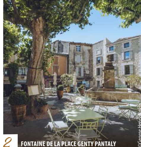
2 FONTAINE DE LA PLACE GENTY PANTALY