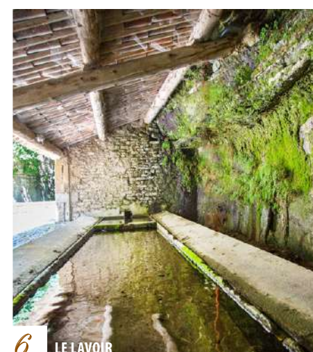
6 LE LAVOIR