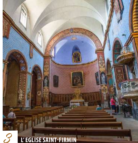
3 L'ÉGLISE SAINT-FIRMIN