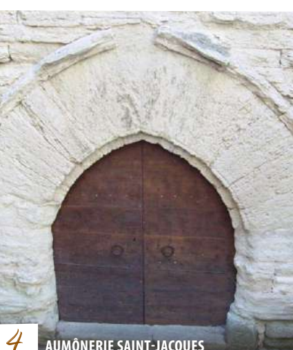
4 AUMÔNERIE SAINT-JACQUES