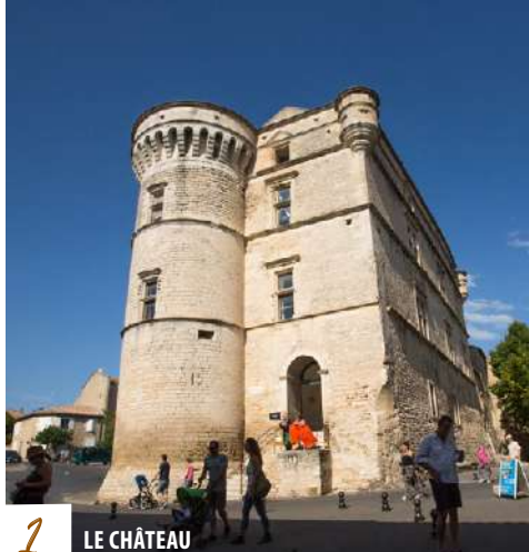
1 LE CHÂTEAU

La vie souterraine de Gordes fut très importante. Chaque maison à étage du village possédait sous ses fondations des caves troglodytiques sur plusieurs niveaux permettant aux artisans et agriculteurs de travailler. Les travaux engagés sous le palais Saint-Firmin permettent d'appréhender ce pan extraordinaire de la vie des habitants pendant des siècles. www.caves-saint-firmin.com/ / Entrée payante